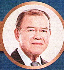
Dr. Supachai Panitchpakdi

Former Secretary-General of UNCTAD and Former Director-General of the World Trade Organization (WTO)