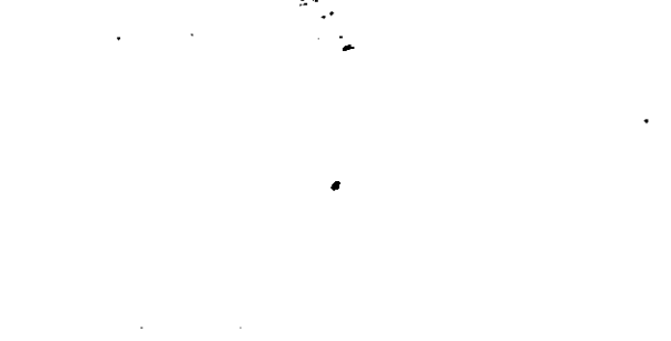
3 . ·